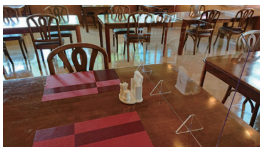
レストランテーブル